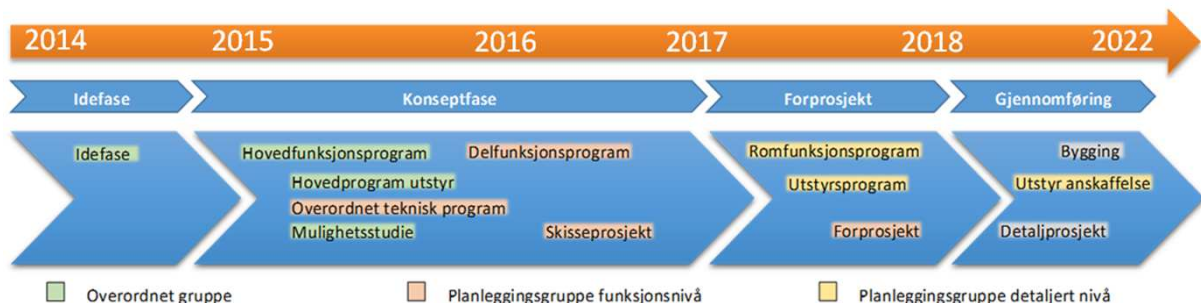
Figur1: Oversikt over innhald i ulike fasar i prosjekt SNR

Styringsdokumentet for konseptfasen skal gi oversikt over alle sentrale høve i prosjektet på ein måte som verkar retningsgivande og avklarande for alle involverte.